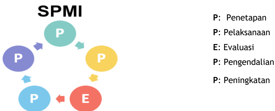
Gambar 1.2 Siklus PPEPP di dalam SPMI

Siklus PPEPP dalam pelaksanaan Penelitian dan Abmas, ditunjukkan di dalam ilustrasi Gambar 1.2 berikut ini.