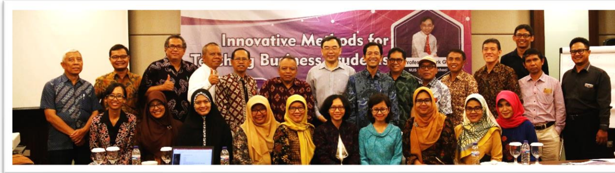
STUDIUM GENERALE, KULIAH TAMU DAN SEMINAR