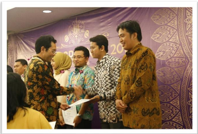
MMT-ITS GRADNITE 2018